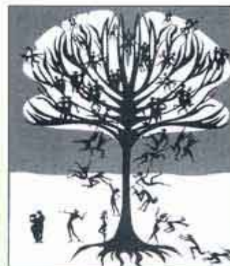
Силуэт работы Луизы Нойверт

Люди упали и разделись на эссенции и мужчин, и теперь они должны вечно искать друг друга.