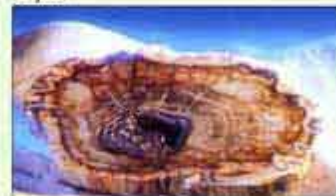
Окаменелость из музея гинкго

Поэт, очень читавший гинкго посвятил ему в 1815 г. стихотворение "Ginkgo Biloba", которое он написал для "Западно-восточного дивана". Уже много столетий дерево используется в лечебных целях. Без него невозможно представить современную фармакологию. Многие медикаменты для лечения сердечно-сосудистых заболеваний содержат экстракты дерева гинкго.